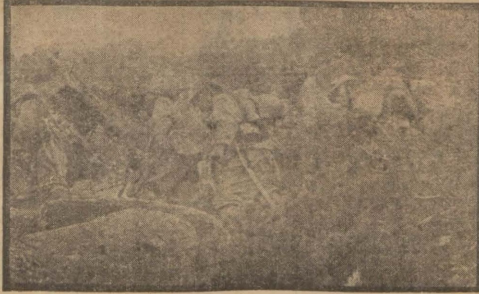
Japon askerleri Malezyada harp ederlerken