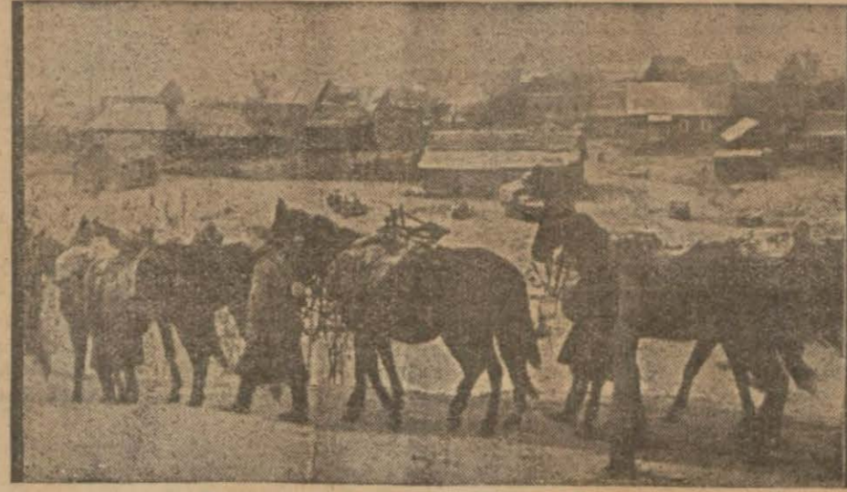
Rusyanın karla kaplı yollarında bir gidiş