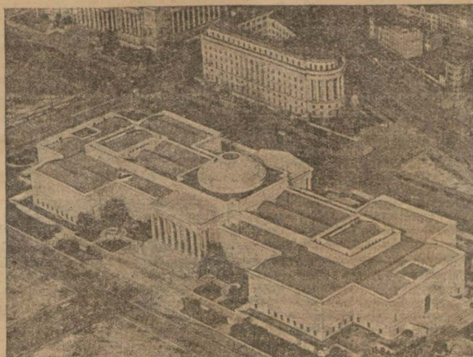
Mühim görüşmelere ve faaliyete sahne olan Vaşingtondan bir görüntü

Harbiye nazırı beyanatına şöyle devam etmiştir: — Rangon üzerine çok tesirli neticeler veren hava hücumları yapılmıştır. Filipinlerde Apari, Vigan ve Legansipi adalarına yeni kuvvetler çıkmıştır. Bu öncü kuvvetler sonradan çıkacak olan kuvvetlerimize zemin hazırlayacaklardır. (Sonu Sahife 2, Sütün 5 te)